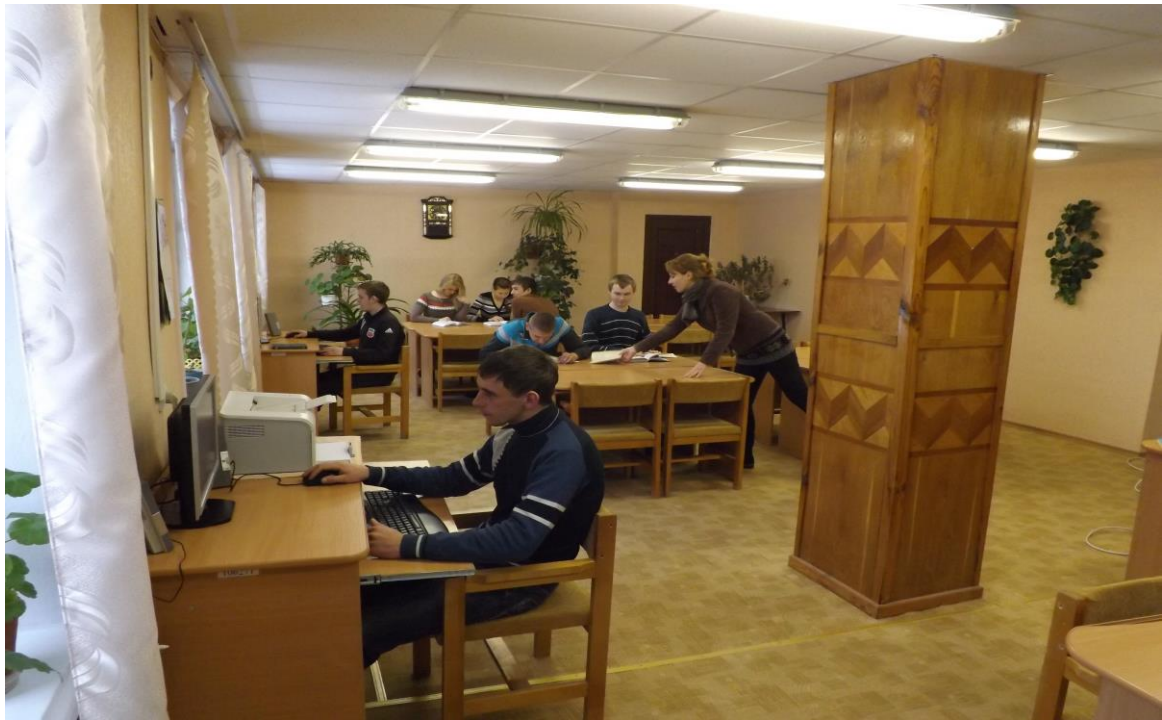
Рис. 37 – Підготовка студентів у бібліотеці

Поставлена мета досягається завдяки тому, що процес виховання у коледжі є двостороннім. Не тільки педагоги виховують студентів, а й сама молодь є активним учасником освітнього процесу: проявляє ініціативу, творчість, вчить нас, дорослих, бути комунікабельними, більш терплячими, спонукає жити життям молоді, їх вподобаннями. І не зважаючи на вік завжди залишатися сучасними і молодими.