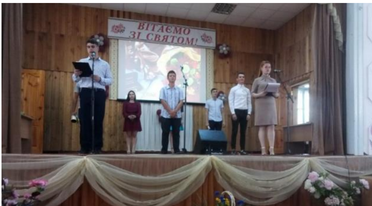
Рис. 18 – Святковий концерт присвяти першокурсників