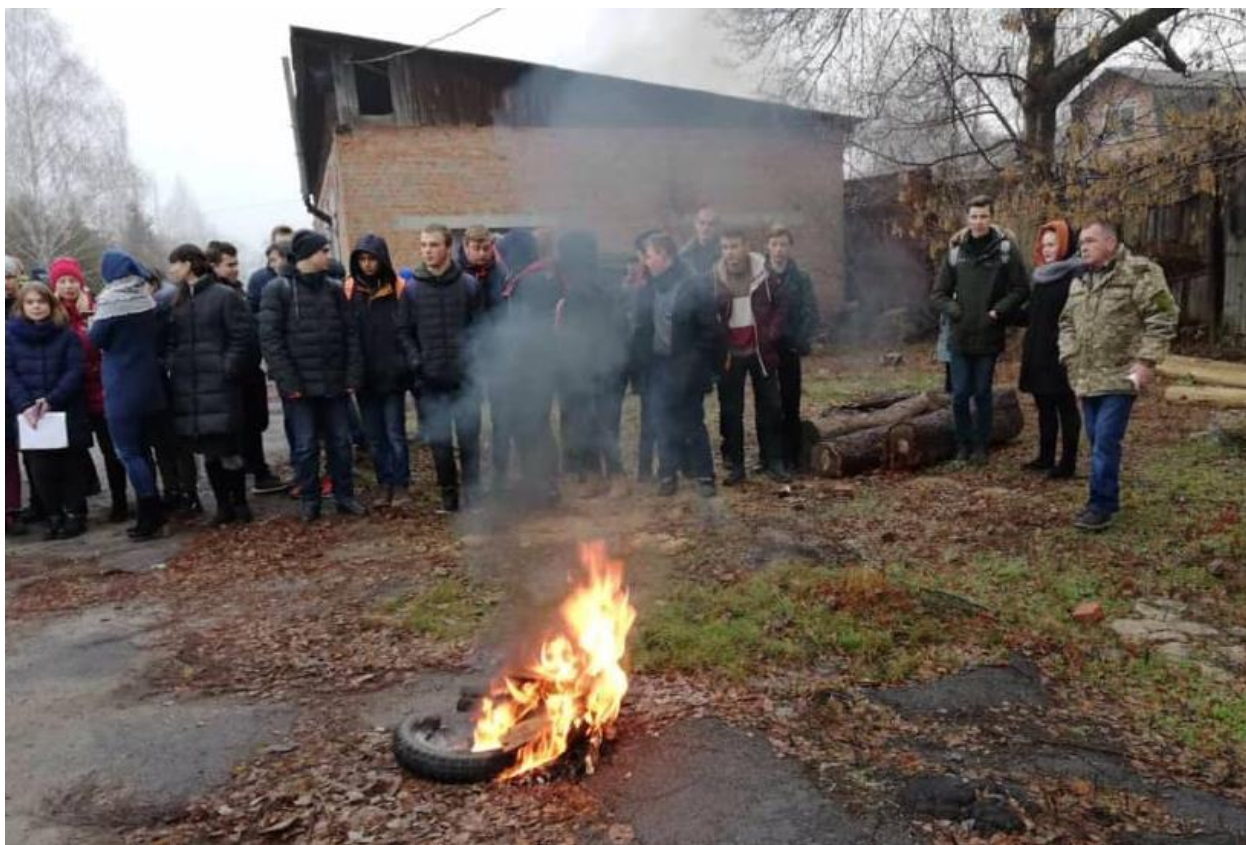
Рис. 12 – Евакуація студентів, тренінг з користування вогнегасниками

Не залишається поза увагою і профілактика шкідливих звичок серед студентської молоді. Класними керівниками і практичним психологом систематично проводяться групові та індивідуальні тематичні бесіди.