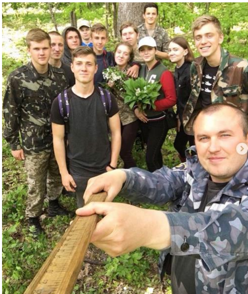
Рис. 25 – Конкурс «Селфі з викладачем»

Величезна науково-дослідна і пошукова робота зі студентами ведеться цикловими комісіями. Наші студенти щорічні учасники і призери різноманітних конкурсів, конференцій, брей-рингів та квестів обласних та всеукраїнських рівнів. 17-19 жовтня 2019 року в Києві проводився II етап Всеукраїнських інтелектуально-спортивних змагань професійного спрямування “FORESTRY QUEST” серед студентів коледжів та університетів, що навчаються за спеціальністю “Лісове господарство” (рис. 26, 27).