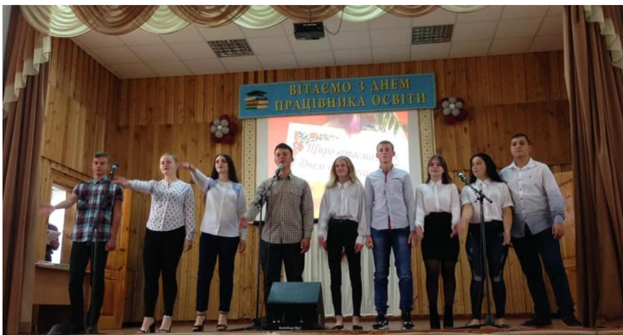
Рис. 16 – Святковий концерт до Дня працівника освіти