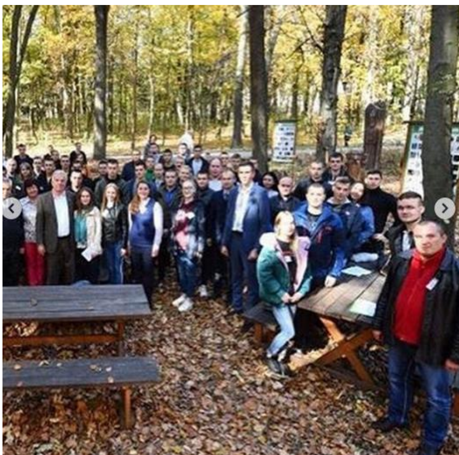
Рис. 26, 27 – Команда коледжу «Вальдмейстри» на “FORESTRY QUEST”