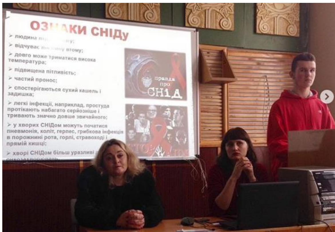
Рис. 15 – Заходи до Міжнародного дня боротьби зі СНІДом