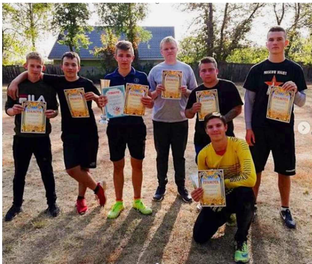
Рис. 31 – Чемпіонат коледжу з футболу

- спартакіада з футболу та стрітболу на базі коледжу (рис. 31); - спартакіада районів і міст Харківської області серед чоловіків з баскетболу.