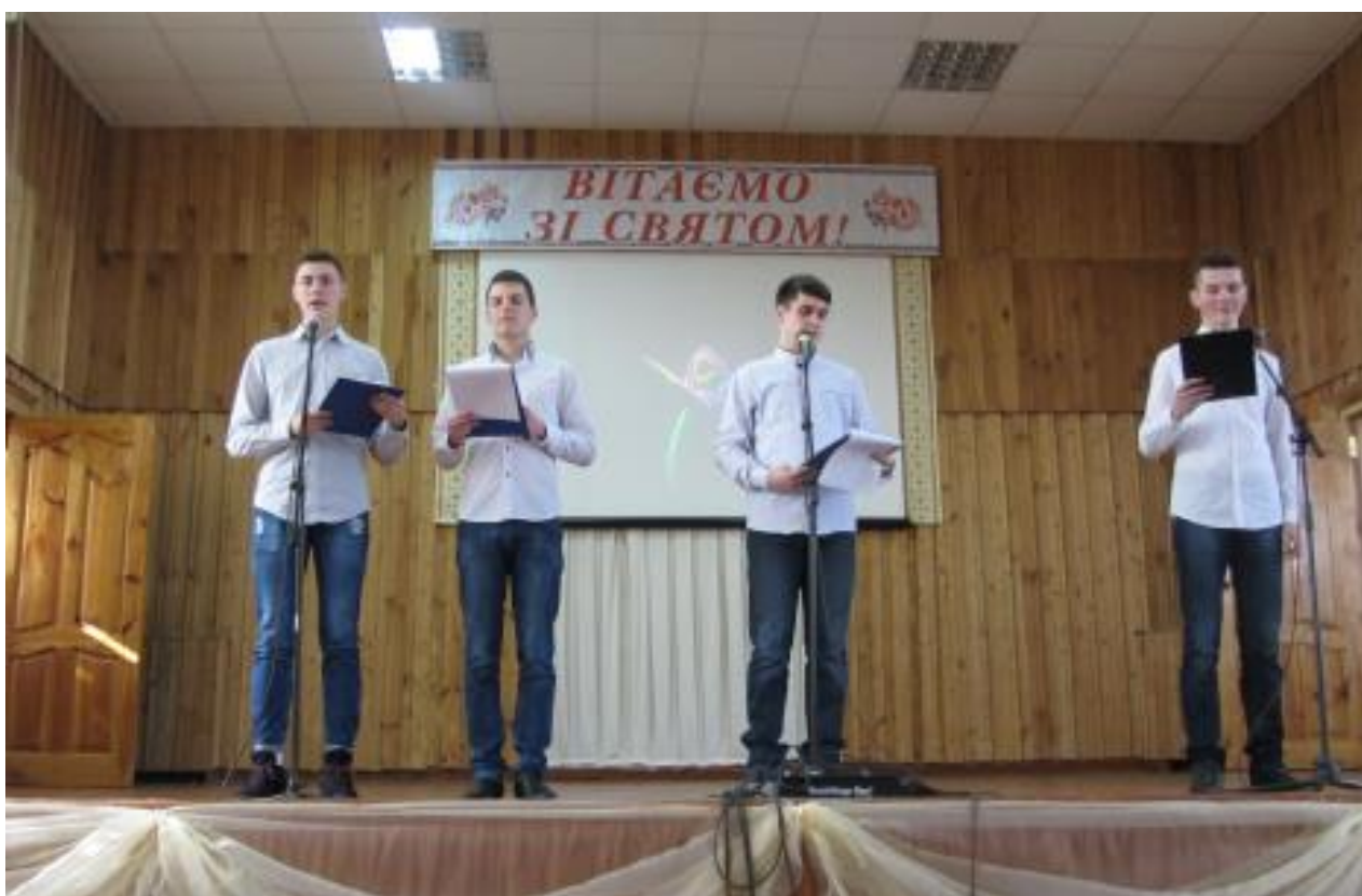
Рис. 17 – Святкування 8 Березня