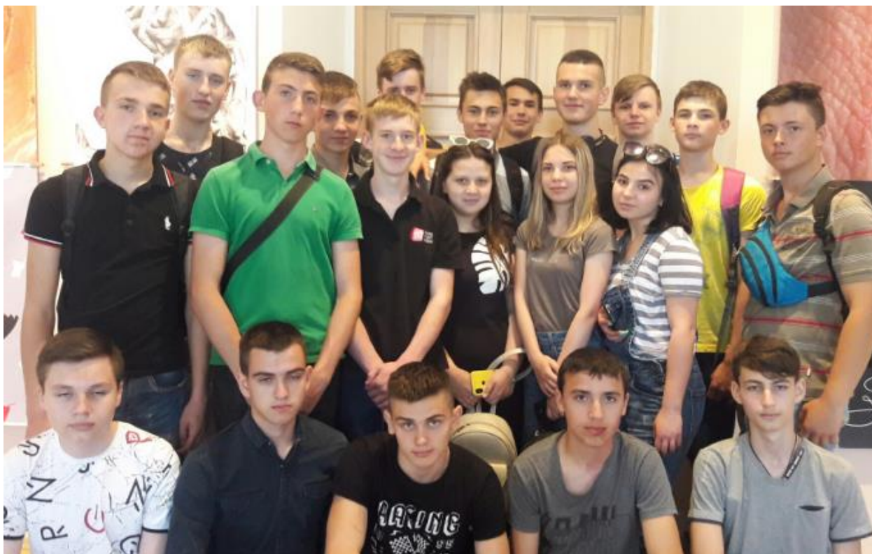
Рис. 24 – Експедиція до художньої галереї

29.05.2019 року студенти коледжу відвідали Чугуївську художню галерею, зокрема, багатотематичну виставку плакатів. Працівники галереї відзначили вихованість та ерудованість наших студентів (рис. 24).