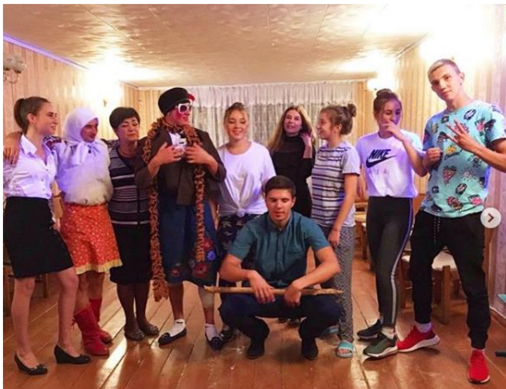
Рис. 35 – «Вечір знайомства з першокурсниками» в гуртожитку

“Клятва першокурсників ЧБЛК”, імпровізовані танці, гумористичні сценки та багато конкурсів – це тільки початок списку того, з чим знайомили і як вітали у гуртожитку цьогорічних першокурсників (рис. 35, 36).