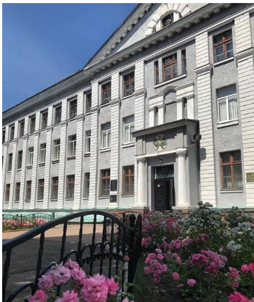
Рис. 33, 34 – Благоустрій дендропарку коледжу