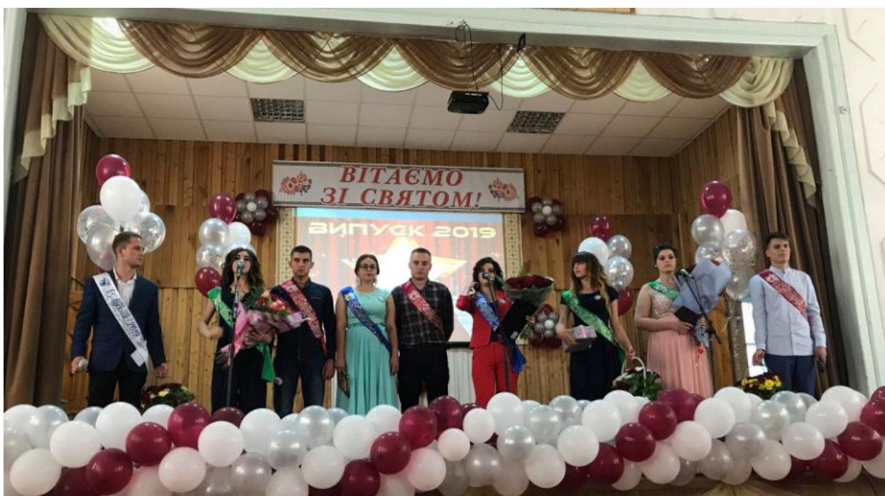
Рис. 19 – Випускний вечір