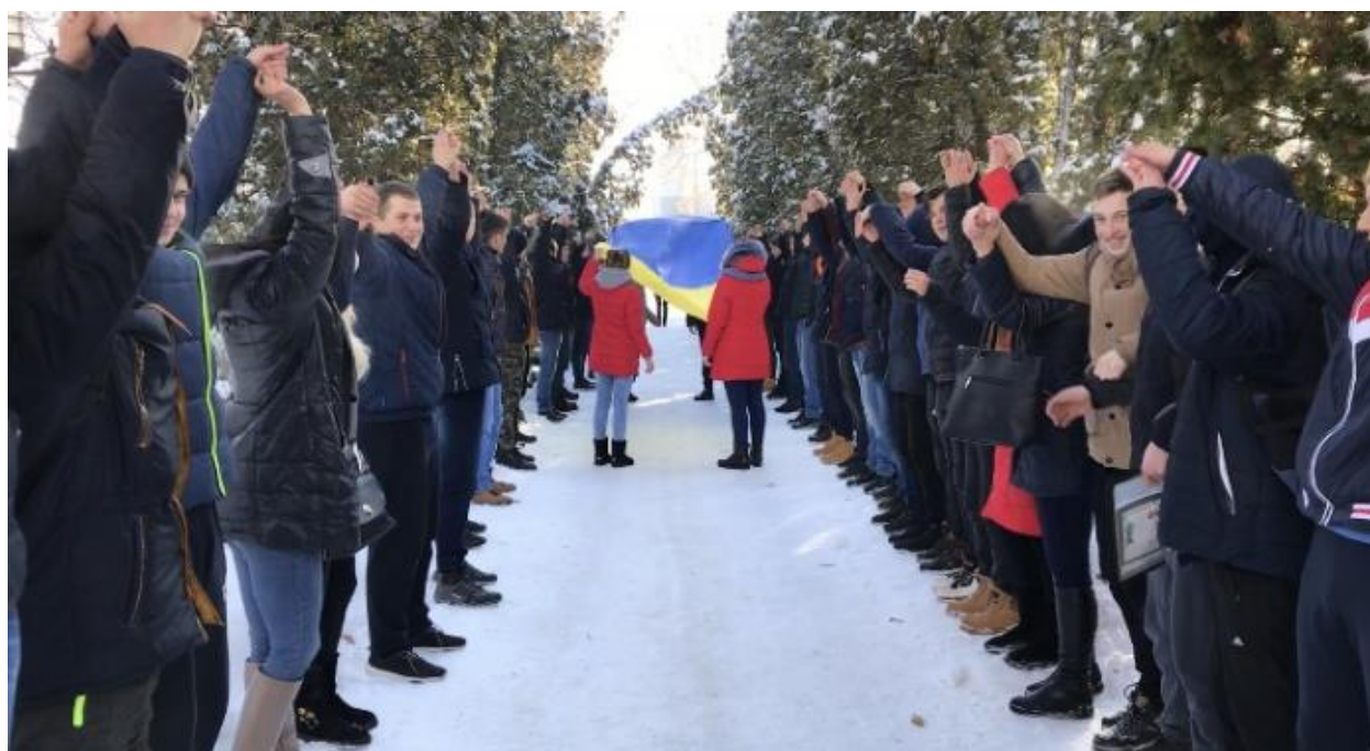
Рис. 3- 4 – Виховні заходи та флешмоб присвячені 100-річчю з Дня Соборності України

28 жовтня відбулась година пам'яті "Тих днів у пам'яті не стерти і сьогодні...". Студенти та викладачі долучились до вшанування цієї знаменної дати: покладено квіти на могилу Невідомому солдату, підготовлені стіннівки, принесені пам'ятні речі, що нагадують про страхіття тих днів.