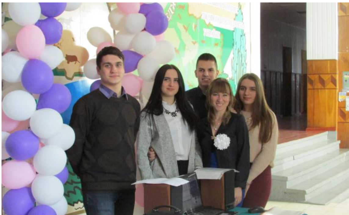
Рис. 22 – Святкування Дня Святого Валентина

5 лютого у світі відзначається День безпечного Інтернету (Safer Internet Day). Викладачі та студенти коледжу також не залишилися осторонь, проведено круглий стіл зі студентами 1 і 2 курсів, де висвітлювалися питання цифрової грамотності, створення, залучення та поширення контенту, використання безпечних і позитивних технологій, онлайн-поведінки тощо (рис. 23).