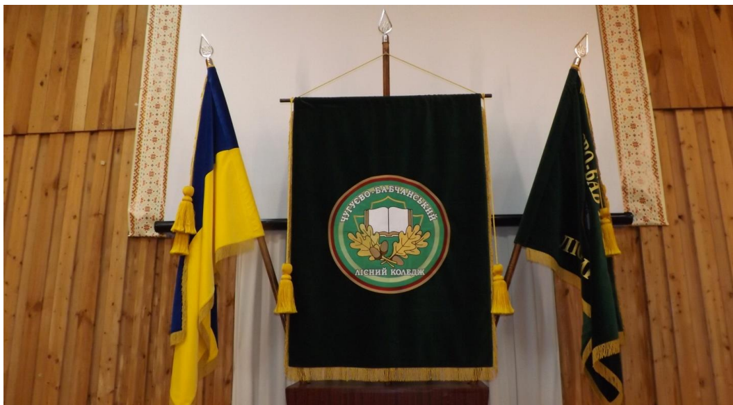
Рис. 1 – Символіка Чугуєво-Бабчанського лісного коледжу

А ще кожна академічна група відвідує музейний комплекс коледжу, де студенти знайомляться з історією селища та історією коледжу (рис. 2), що забезпечує духовну єдність поколінь, виховання поваги до старших, до культури та історії рідного краю.