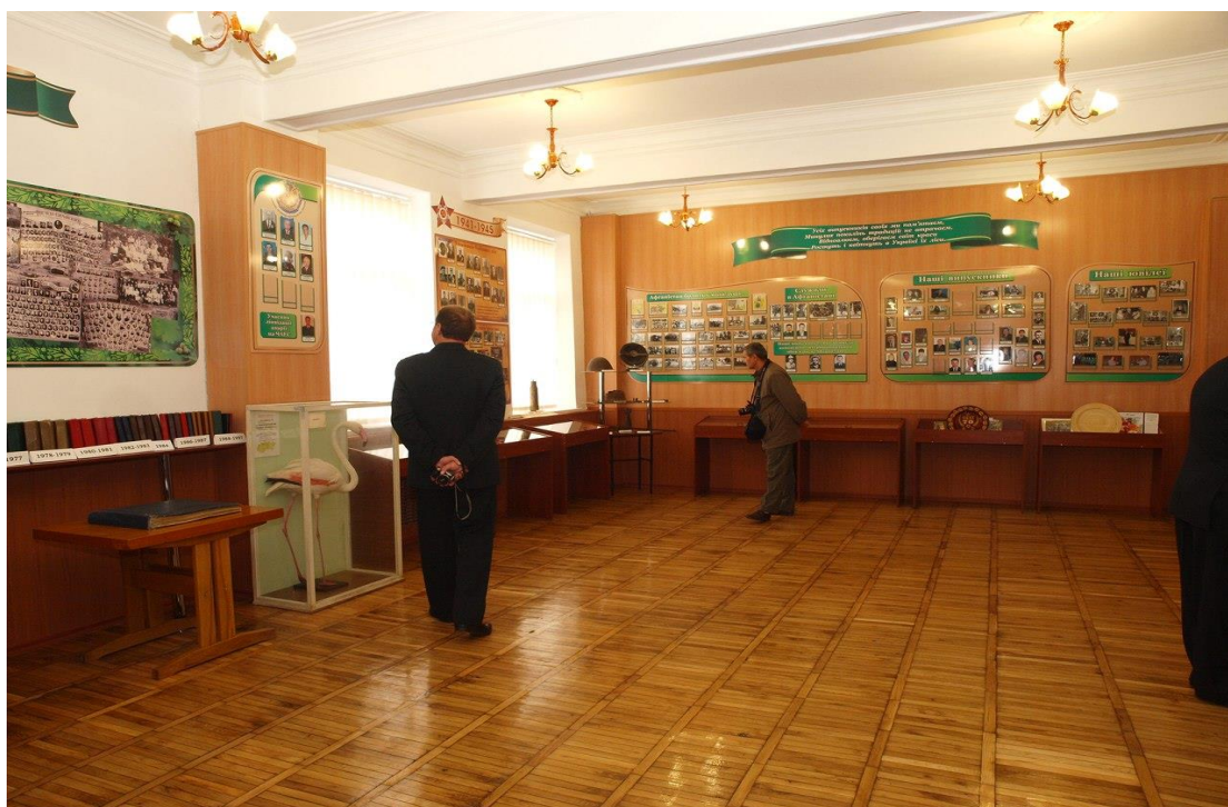
Рис. 2 – Музей Чугуєво-Бабчанського лісного коледжу

Велика увага приділяється національно-патріотичному вихованню студентів – формуванню ціннісних орієнтацій до держави та суспільства для виховання соціально компетентного, активного, відповідального громадянина й патріота України. Таке виховання розвиває почуття гордості та любові до рідного краю і приналежності до української нації, підвищує інтерес до вивчення історії і духовних скарбів своєї держави, сприяє формуванню правосвідомості студентів. Робота проводиться згідно положень Конституції України та Концепції національно-патріотичного виховання.