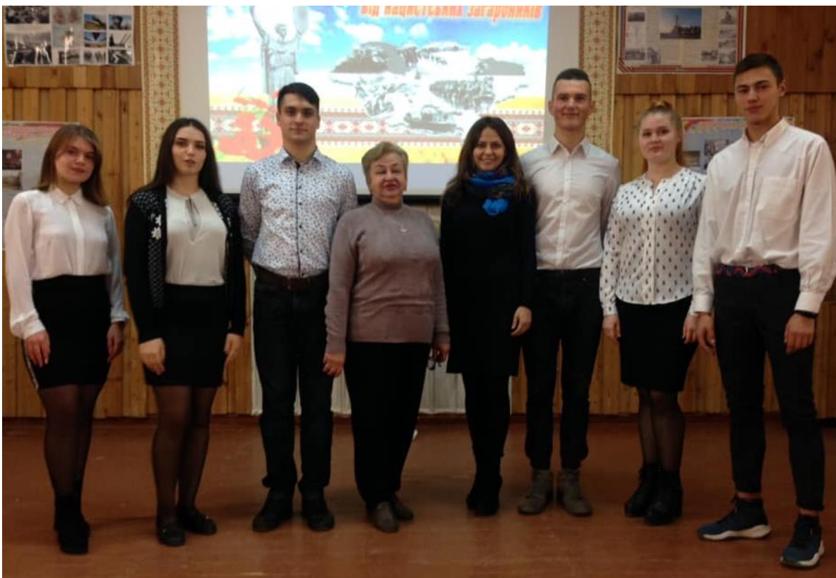
Рис. 5 – Виховний захід до 75-річчя визволення з території України

16.09.2019 проведений виховний захід про чарівні куточки нашого краю "Дивовижна Харківщина" (рис. 6).