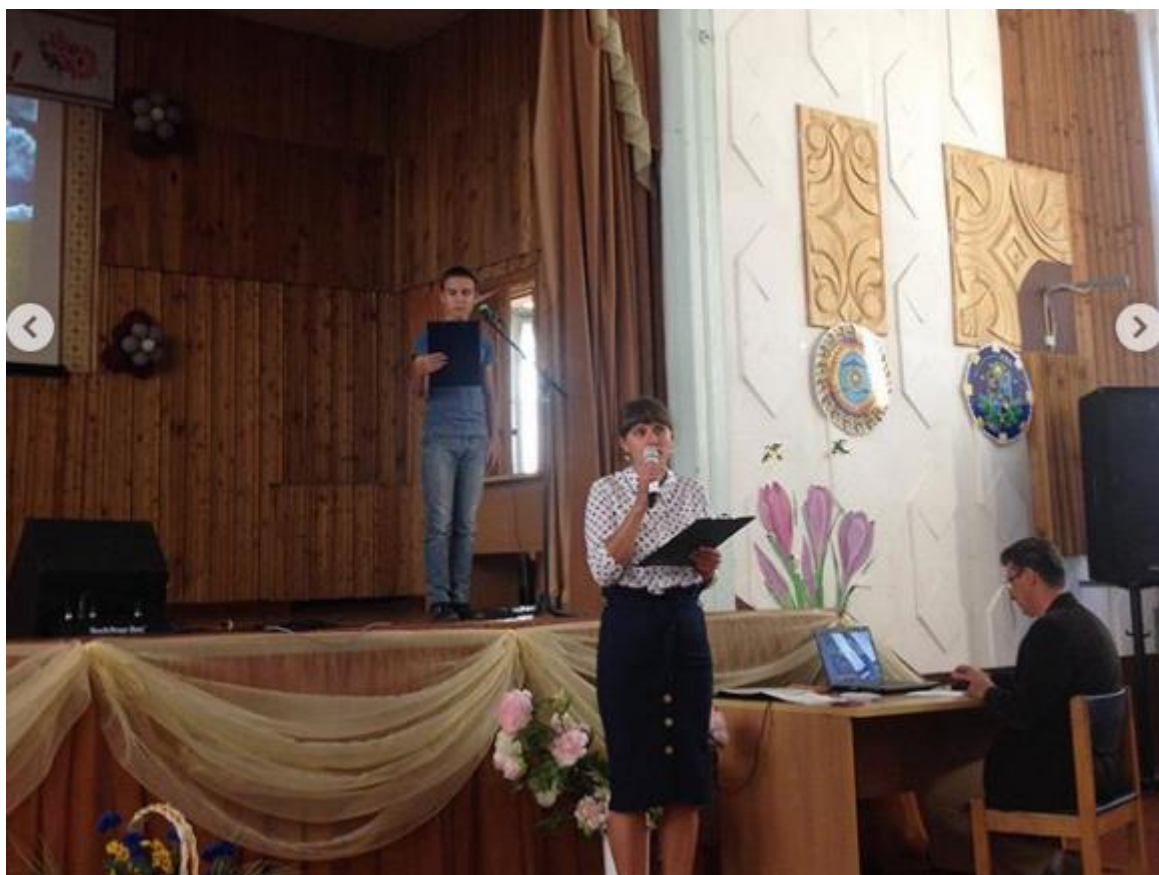
Рис. 6 – Захід "Дивовижна Харківщина"

16.09.2019 проведений виховний захід про чарівні куточки нашого краю "Дивовижна Харківщина" (рис. 6).