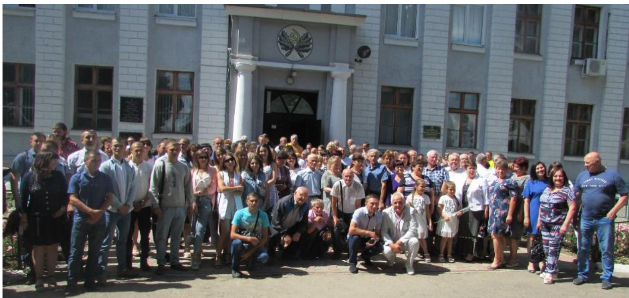
Рис. 20, 21 – Зустріч випускників минулих років

Своєю ефективністю відзначаються фестиваль художньої самодіяльності до Міжнародного Дня студента, «День святого Валентина», тощо (рис. 22).