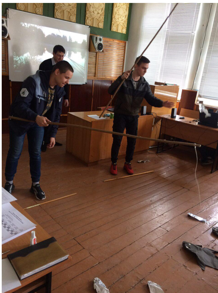
Рис. 29, 30 – Заходи в рамках тижня циклової комісії спеціальності «Експлуатація і ремонт ОЛК»