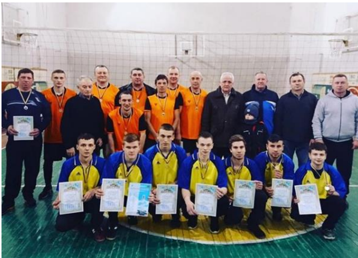
Рис. 32 – Волейбольний турнір

Велика увага у коледжі приділяється екологічному вихованню. Щовесни студенти та працівники коледжу є активними учасниками Всеукраїнської акції «Майбутнє лісу у твоїх руках» і місячника по озелененню та благоустрою навколишніх територій. Також щороку в березні в рамках щорічної всеукраїнської акції з благоустрою «За чисте довкілля» понад 500 працівників та студентів коледжу на території селища Кочеток, Чугуївського та Печенізького районів прибирають більше 23 га територій, ліквідовують несанкціоновані сміттєзвалища, висаджують десятки дерев і кущів, упорядковують «Парк слави», братські могили воїнів тощо.