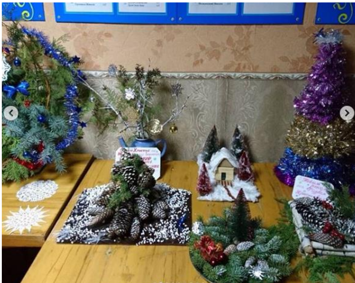
Рис. 36 – Виставка-конкурс на кращу новорічну композицію

До роботи в різних напрямках виховання студентської молоді долучаються і працівники бібліотеки. Вони готують тематичні вечори, виставки, презентації, зустрічі з письменниками, громадськими діячами, випускниками коледжу, проводять інтелектуальні вікторини. І це дає свої результати. Сьогодні бібліотека – це осередок інтелектуального розвитку особистості студента (рис. 37).