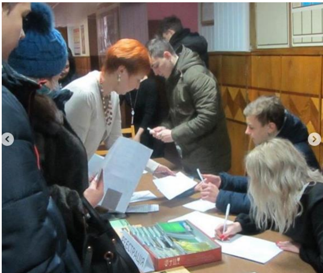
Рис. 8 – День відкритих дверей

Щорічно в коледжі проводяться Дні відкритих дверей для майбутніх студентів. З кожним роком такі заходи набувають нового формату. Потенційні абітурієнти не тільки ознайомлюються із спеціальностями і матеріально-технічною базою коледжу, а і беруть участь в різноманітних конкурсах, вікторинах та запрошуються до участі в науково-практичних конференціях на базі ЧБЛК. (рис. 8).