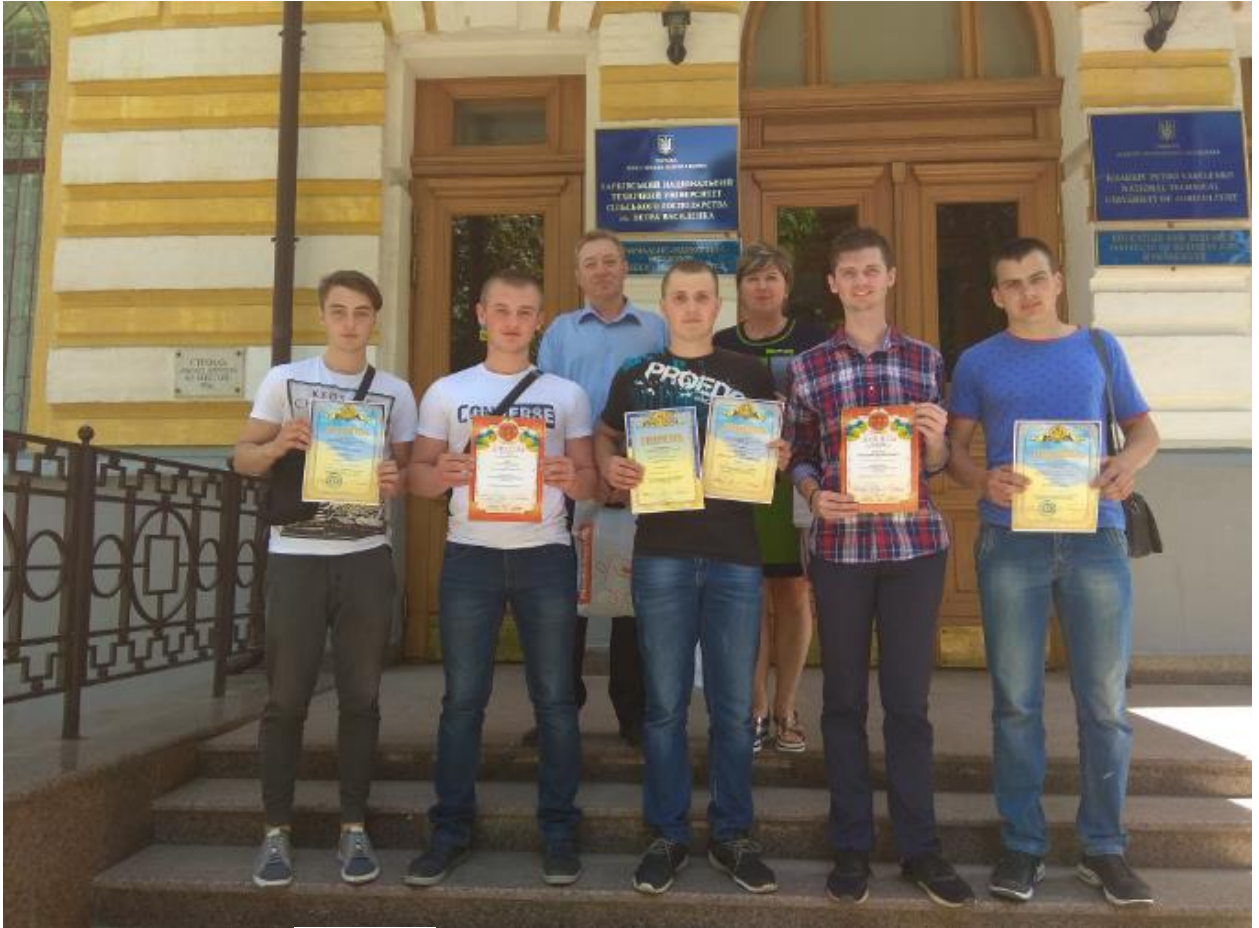
Рис. 28 – Всеукраїнська студентська олімпіада «Обладнання лісового комплексу»

В березні студенти отримали друге і третє місця на олімпіаді з лісового господарства у м. Львів. 20-21 травня проводився II етап Всеукраїнської студентської олімпіади «Деревообробні та меблеві технології», «Обладнання лісового комплексу», де студенти коледжу також отримали призові місця (рис. 28).