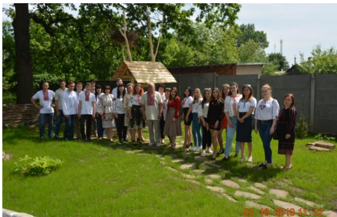
Рис. 9-10 – День вишиванки