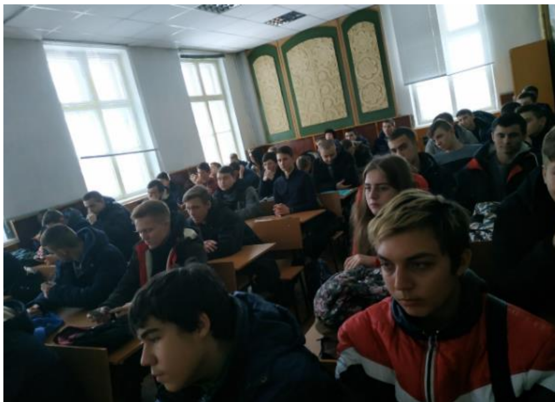
Рис. 23 – День безпечного інтернету

5 лютого у світі відзначається День безпечного Інтернету (Safer Internet Day). Викладачі та студенти коледжу також не залишилися осторонь, проведено круглий стіл зі студентами 1 і 2 курсів, де висвітлювалися питання цифрової грамотності, створення, залучення та поширення контенту, використання безпечних і позитивних технологій, онлайн-поведінки тощо (рис. 23).